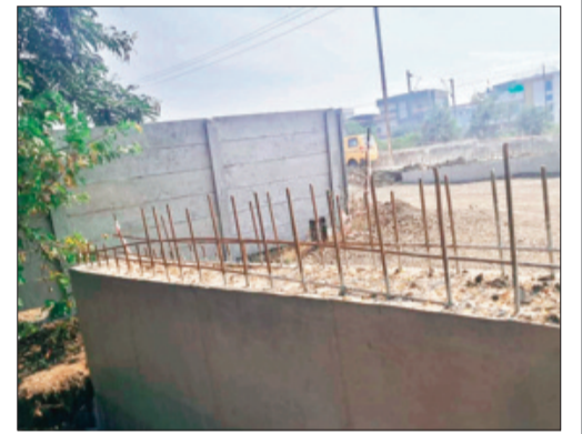
राशि 2.76 करोड़ होने के बावजूद 1700 मीटर सर्विस रोड का निर्माण नहीं हो रहा है।